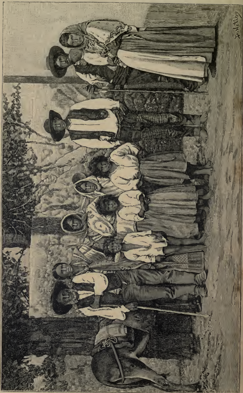
GRUPO DE CIGANOS ALENTEJANOS INDO PARA A FEIRA DE ALTEIR-DO-CHÃO